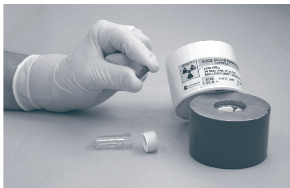
Gélule contenant la dose d'iode radioactif

Le traitement peut être renouvelé au bout de quelques mois en cas de nécessité.