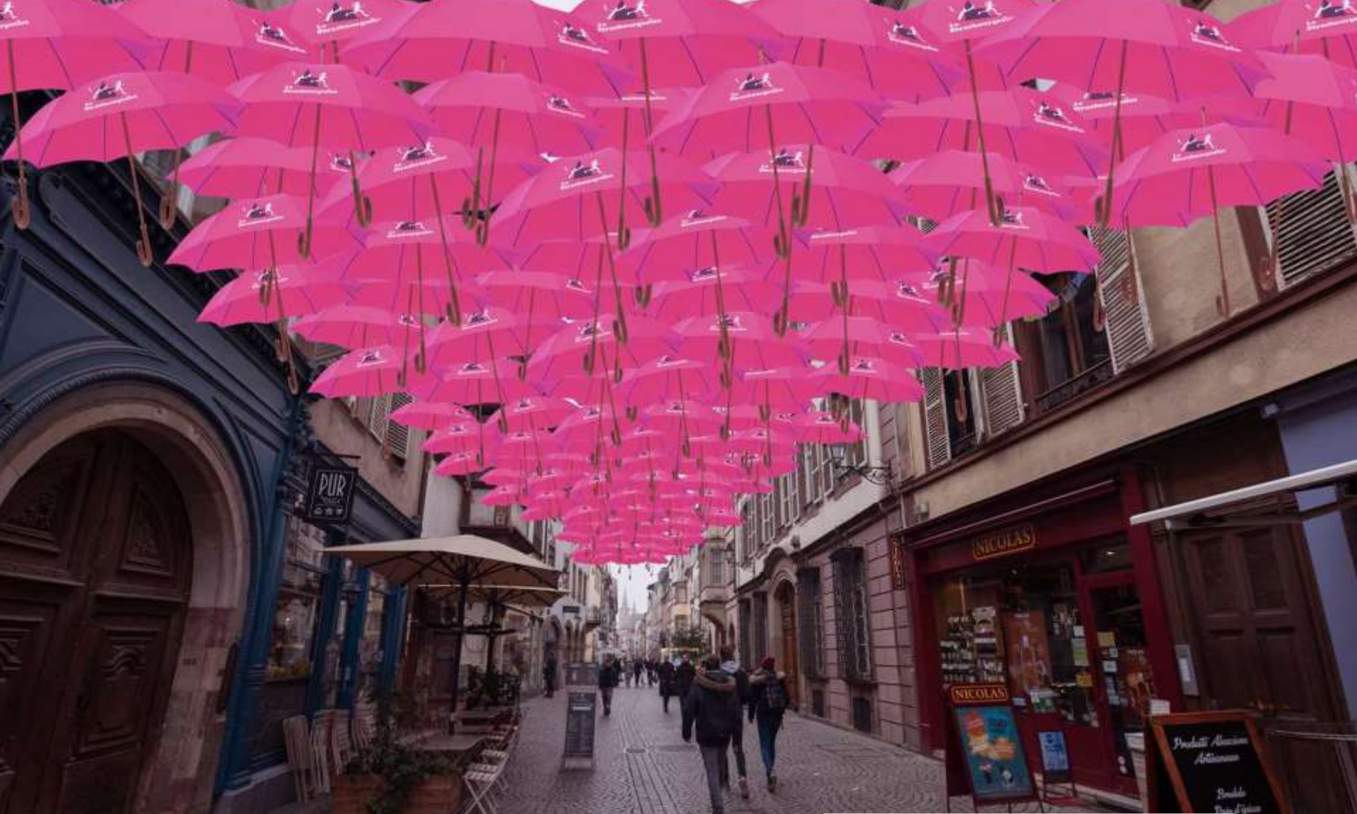
Strasbourg en rose Grand Rue