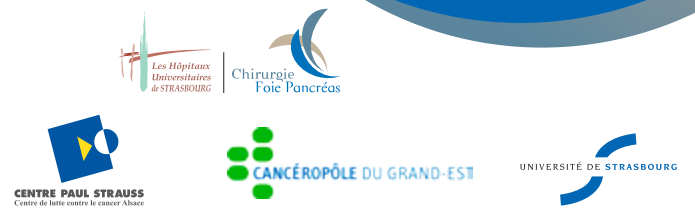
Facta & Verba - 10/15