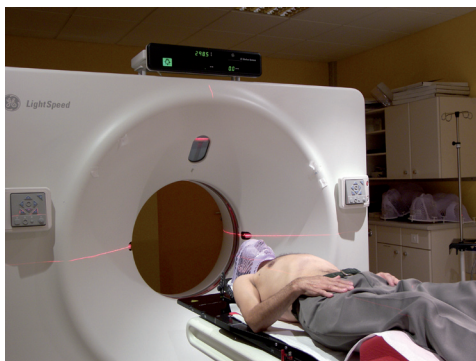
La position de traitement est décidée lors du scanner

Au moyen d'un scanner exclusivement dédié à la préparation du traitement, des images de la région du corps à irradier sont réalisées. La position que vous devrez adopter à chaque séance est déterminée avec précision lors de ce scanner ( le plus souvent allongée sur le dos, plus rarement à plat ventre ). À partir de ces images scanographiques, le médecin délimite avec précision les contours de la zone à traiter de même que les différents organes sains à proximité, et ce en vue du calcul de la dose reçue par chacun d'entre eux. Plusieurs points de repère seront tatoués sur la peau pour permettre la mise en place des faisceaux d'irradiation lors de chaque séance de traitement. Une fois le contourage des différents volumes d'intérêt terminé par le médecin, ces données sont transférées à l'équipe des physiciens qui réalise la dosimétrie prévisionnelle informatisée aussi appelée plan d'irradiation.